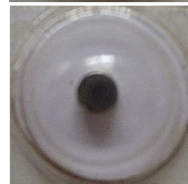
Wskaźnik po zadziałaniu pola magnetycznego o natężeniu od 35 kA/m