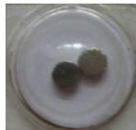
Wskaźnik przed zadziałaniem pola magnetycznego

Wskaźnik pola magnetycznego CFI-L jest przedmiotem zgłoszeń patentowych oraz wzorów użytkowych w Polsce i kilku innych krajach